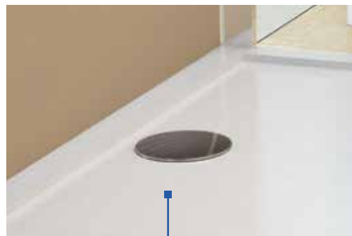
Conçue pour des receveurs extra-plats