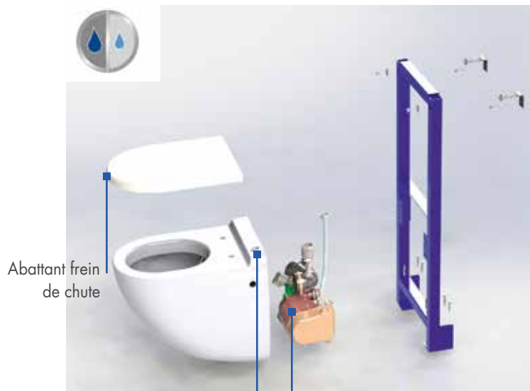
Abattant frein de chute Bouton de chasse 2/4L Moteur silencieux Adapté aux personnes à mobilité réduite