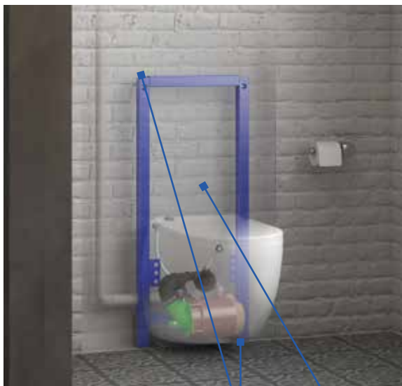
Bâti-support universel autoportant à fixer au sol et au mur Habillage à carreler