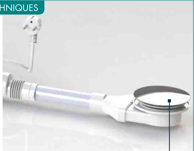
Déclenchement bas, 30 mm, adapté au receveur extra-plat