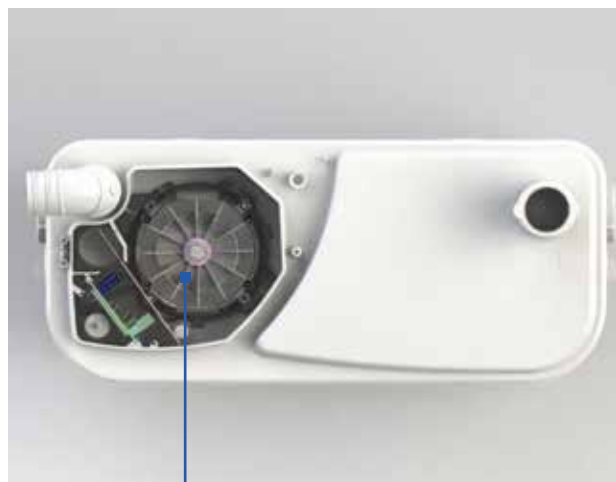
Équipée d'un moteur ultra puissant