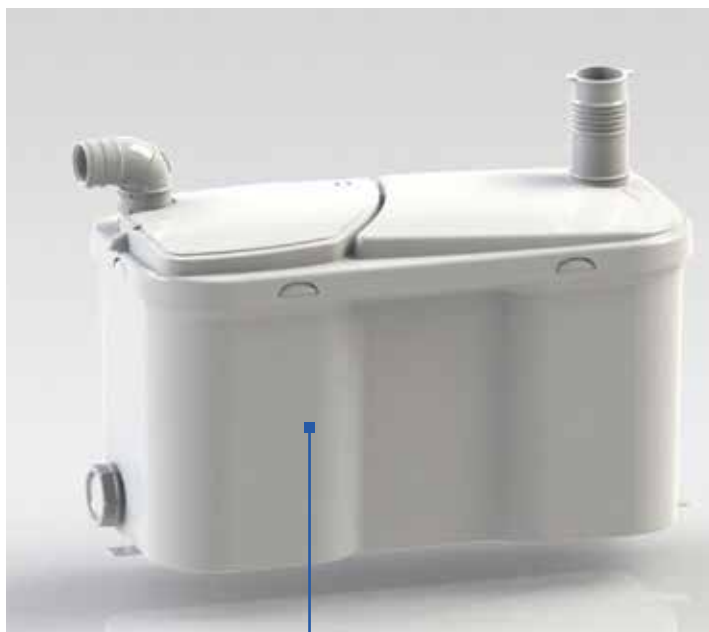
Permet le raccordement de 3 appareils dont une baignoire