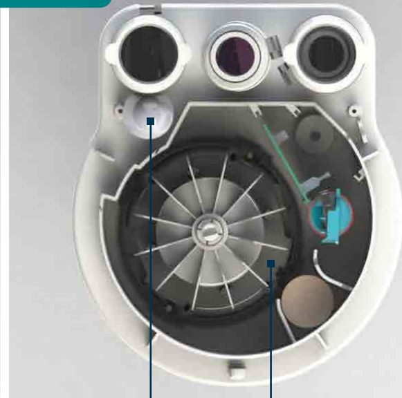
Dispositif ultra performant à clapet d'évent évitant la remontée de mousse