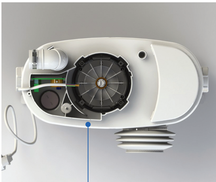
Moteur nouvelle génération ultra silencieux