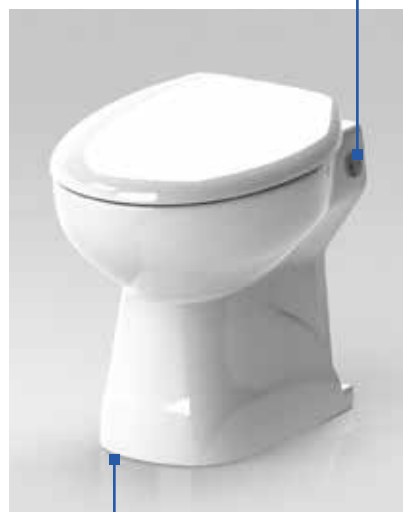
Système double touche économie d'eau 2/4 litres